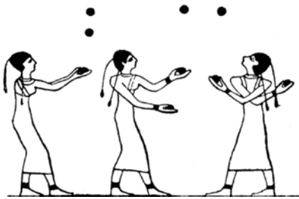
1 - Jongleuses de Beni-Hassan, 2000 av. J.-C. Egypte