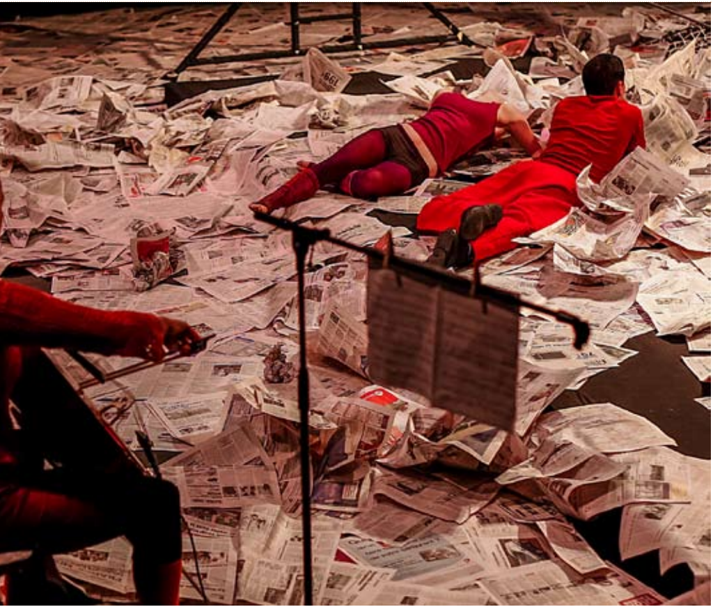
Spectacle des écoles, Circa 2008