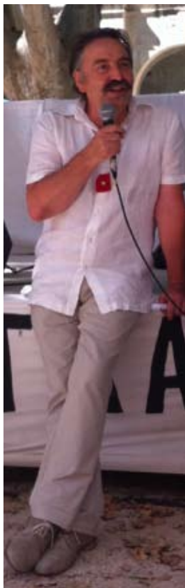
FLORIAN SALAZAR-MARTIN, PRÉSIDENT DE LA FNCC