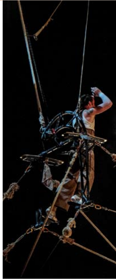
Compagnie Cirkvost, Circa 2010

Enfin, le cirque contribue activement à la vie culturelle des territoires et à l'éducation artistique de jeunes au travers d'un très important réseau d'écoles de cirque réunies au sein de la Fédération française des écoles de cirque (FFEC).