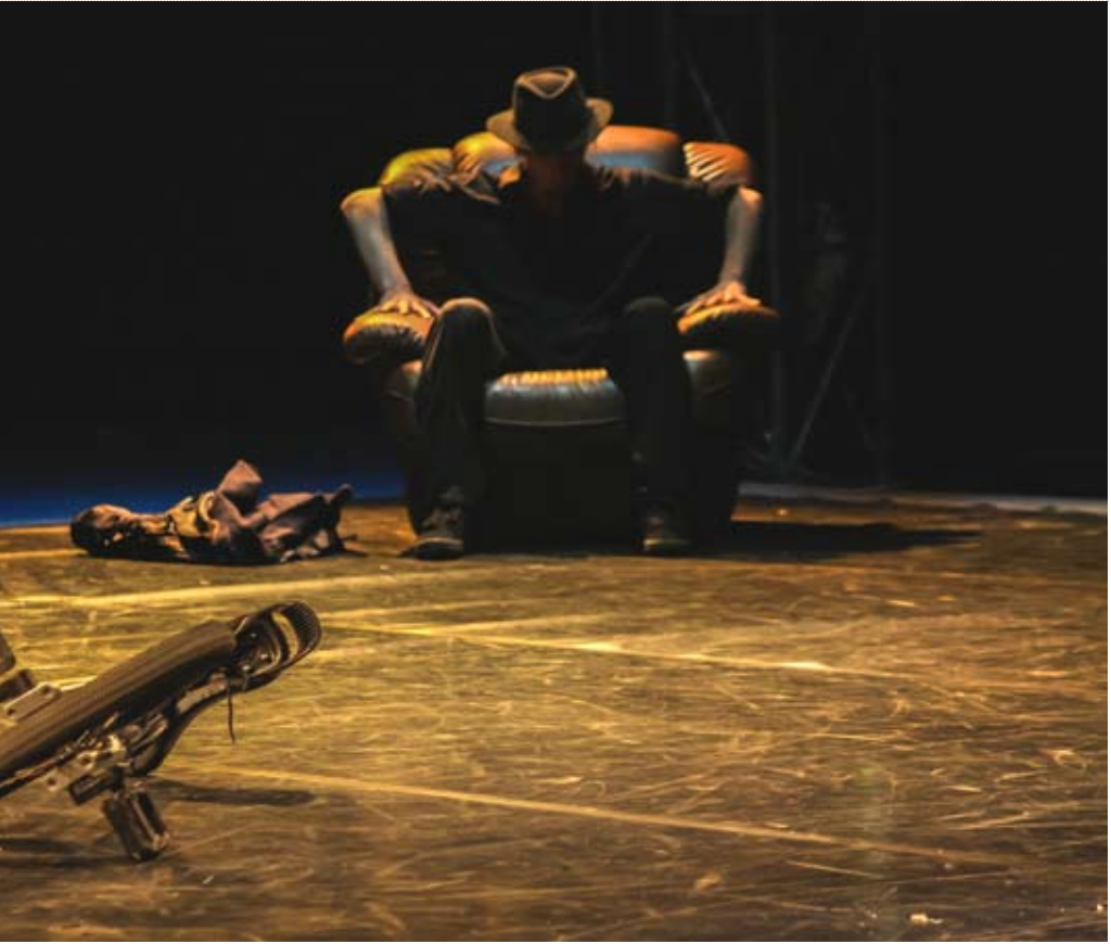
Spectacle des écoles, Circa 2012

Centre national des arts du cirque (CNAC). L'établissement supérieur de formation et de recherche, fondé en 1985 à l'initiative du ministère de la Culture, assure trois missions :