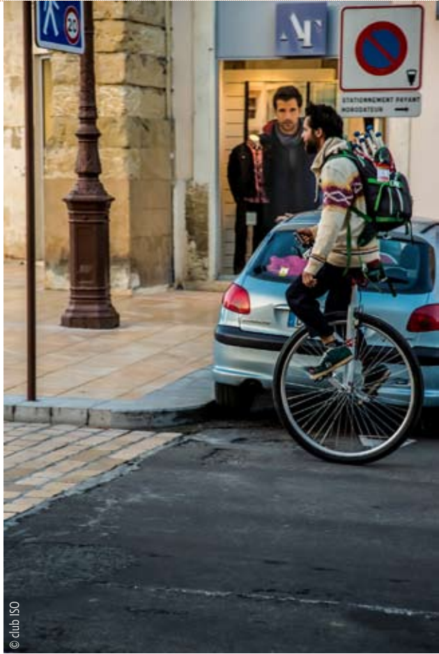
Dans les rues d'Auch

Cirque et intercommunalité. De ce point de vue, l'essor de l'engagement culturel des intercommunalités peut, inversement, être un atout pour le cirque. Jusqu'à présent, les politiques culturelles communautaires sont surtout caractérisées par la gestion d'équipements, essentiellement les bibliothèques et les établissements d'enseignement artistique. Une politique d'accueil de spectacles de cirque – et, avec eux, leurs possibilités de travail autour des spectacles, notamment en direction des milieux scolaires – peut constituer l'une des bases d'un réel projet culturel communautaire. ■