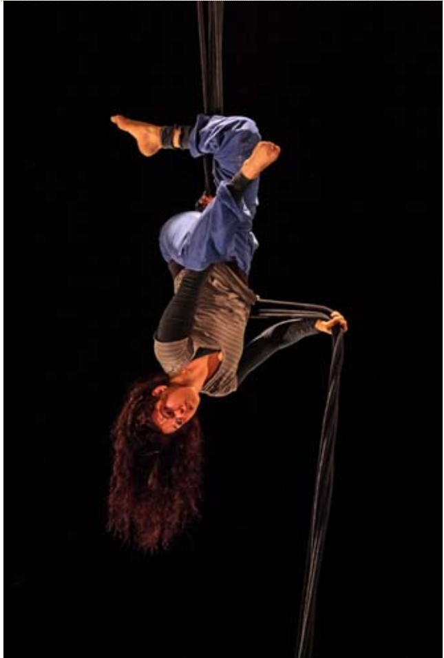
Urban Rabbits, Circa 2010