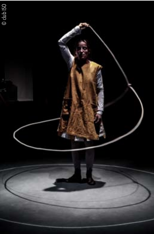
Compagnie L'orage et le cerf-volant, Circa 2011

Les arts du cirque tiennent une position stellaire dans notre imaginaire, en lien avec la vie et la mort, avec notre fragilité existentielle. Ils sont pluriels dans leurs formes mêmes où s'entremêlent différentes techniques, dans leurs esthétiques qui vont du spectacle traditionnel au cirque dit contemporain. Pluriels également par le croisement de la virtuosité physique et de la sensibilité artistique, par les modalités de représentation. Pluriels aussi par la diversité des territoires qu'ils choisissent d'explorer sur le mode de l'itinérance. Mais cette diversité ne déjoue pas une forte unité : la capacité à croiser les publics de toutes générations et de toutes origines sociales et la nature "citoyenne" d'expressions artistiques se déployant dans la proximité.